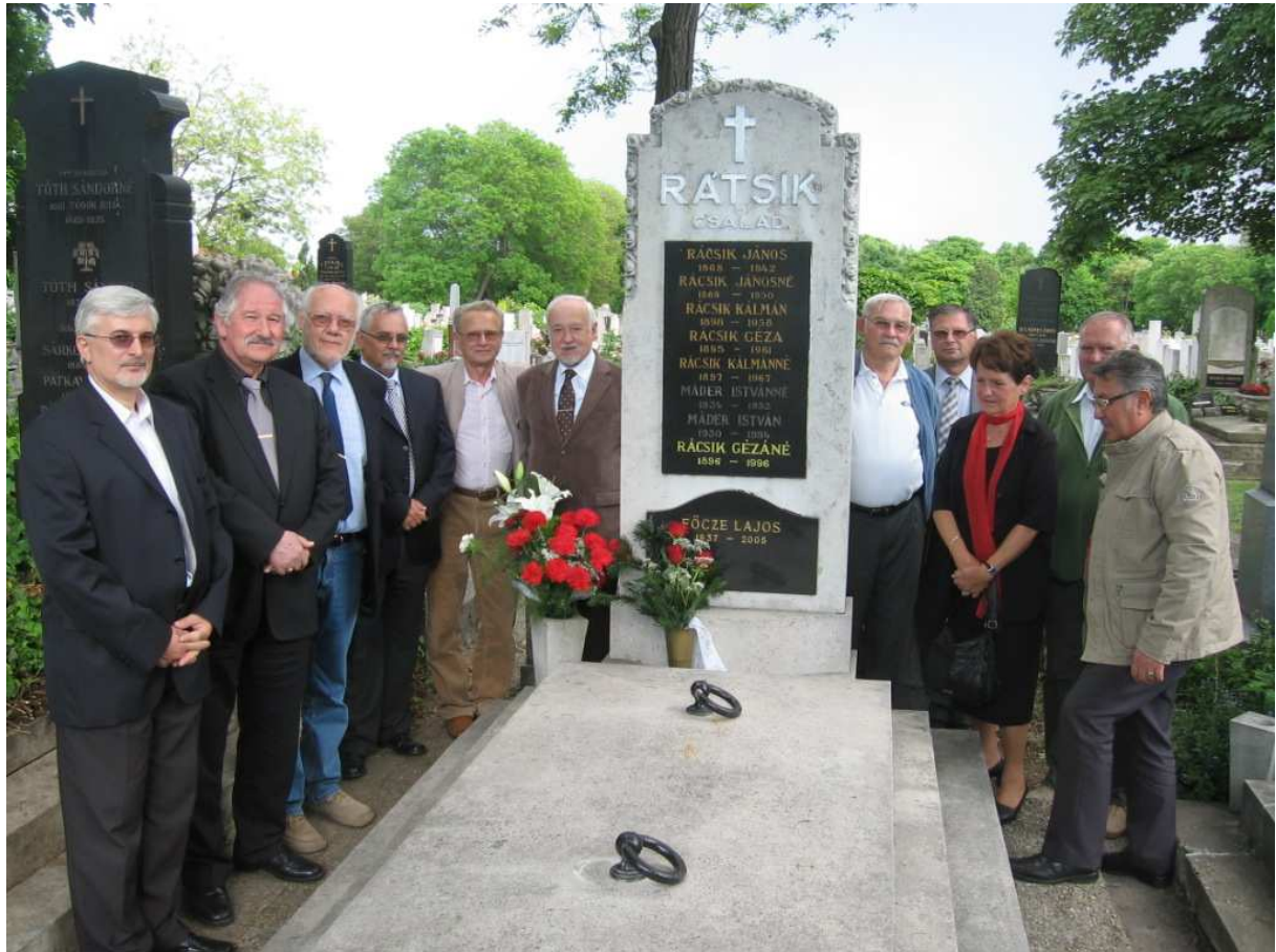
A megemlékezés résztvevői