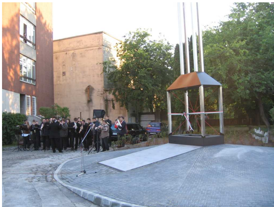
A Csepeli Munkásotthon Fesztivál Fúvószenekara