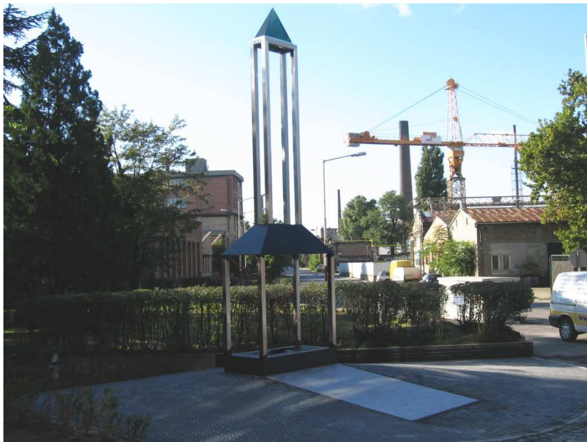
Az emlékmű helyszíne