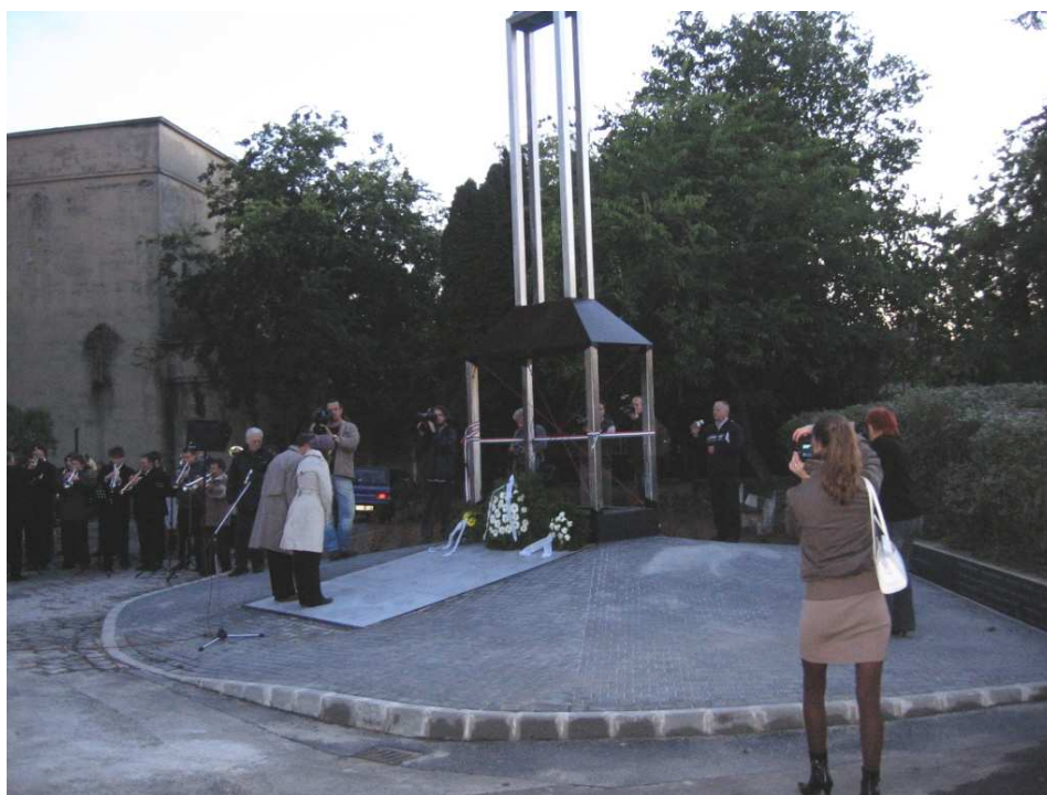
Az emlékmű megkoszorúzása