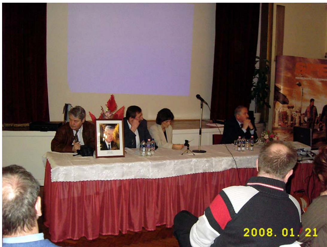
A Konzultatív Fórum elnöksége